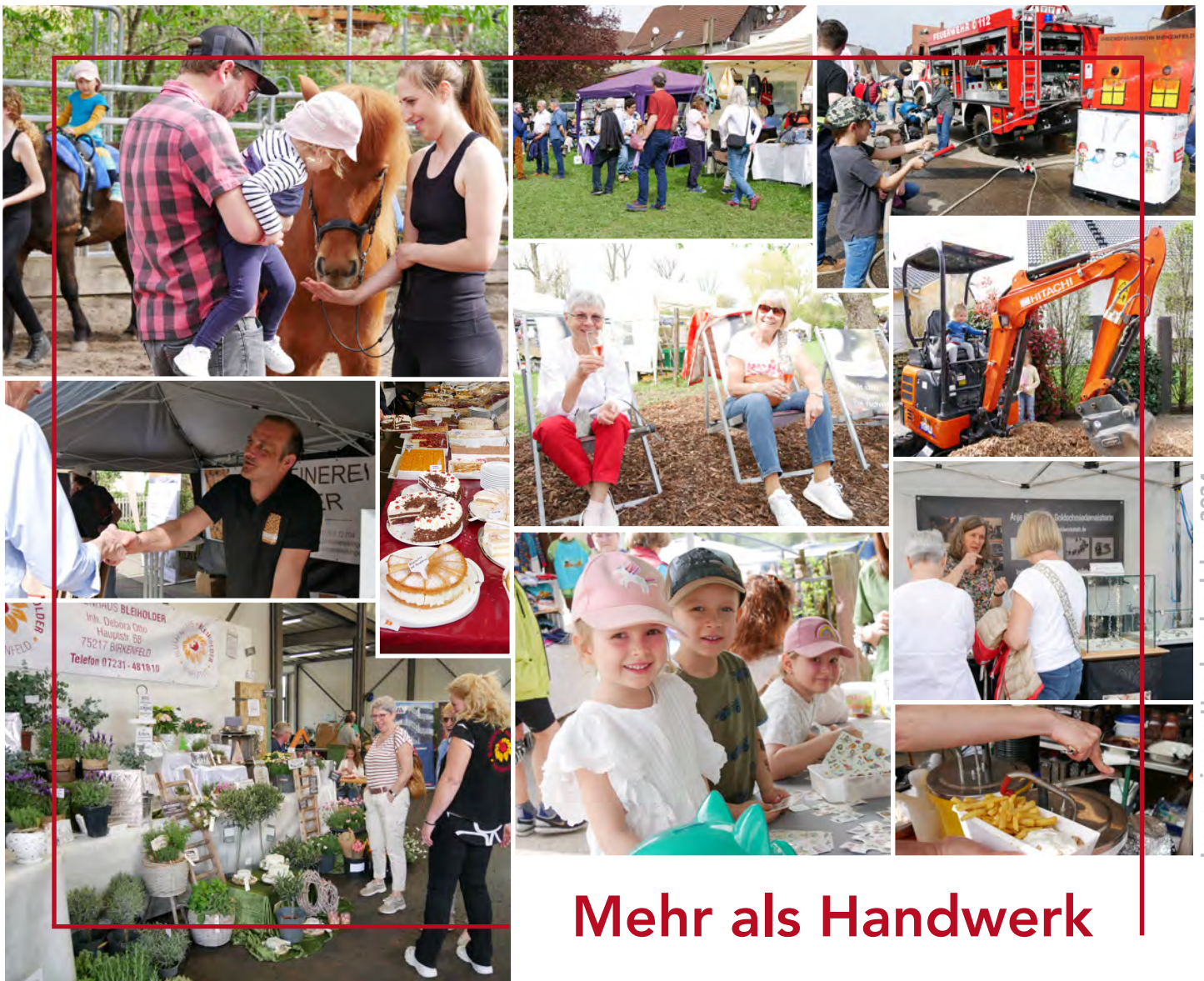
Impressionen Handwerk erleben 2024